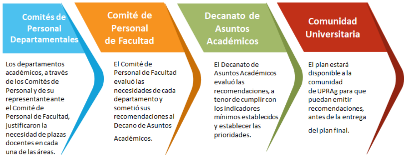
Figura 1. Proceso y participación en el desarrollo del Plan de Reclutamiento de Docentes 2021-2022.

Para desarrollar el Plan de Reclutamiento de Docentes 2021-2022 en UPRAg, se incorporaron las recomendaciones de los Comités de Personal Departamentales, del Comité de Personal de Facultad, del Decanato de Asuntos Académicos y de la comunidad universitaria en general. La Figura 1 muestra el proceso de desarrollo del Plan y la participación que tuvieron cada uno de los cuerpos.